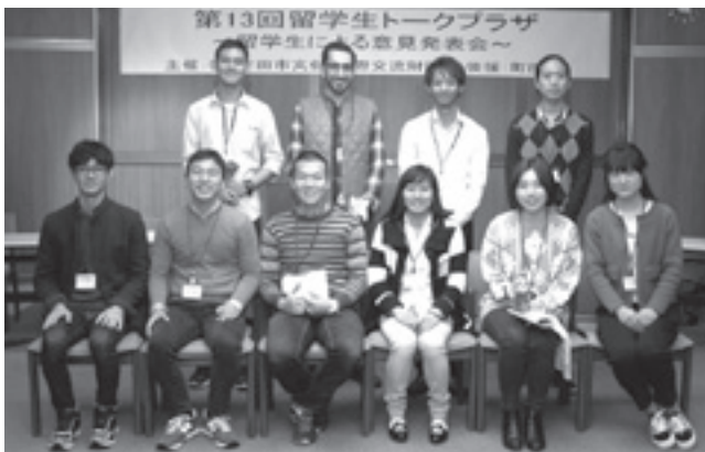
留学生の皆さん。これからの活躍に期待しています。