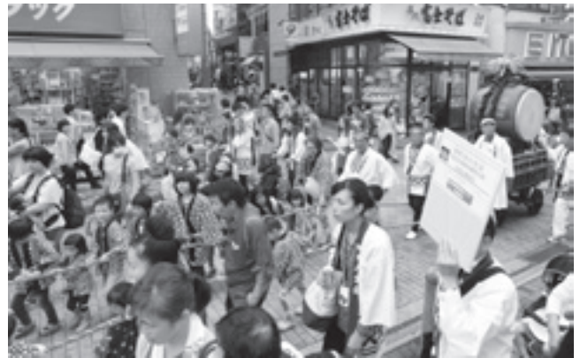
こどもたちが一生懸命山車を引きました