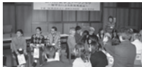
市民との懇談も盛況でした