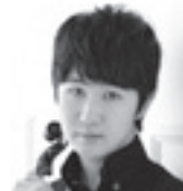
島田光博(ヴァイオリン)