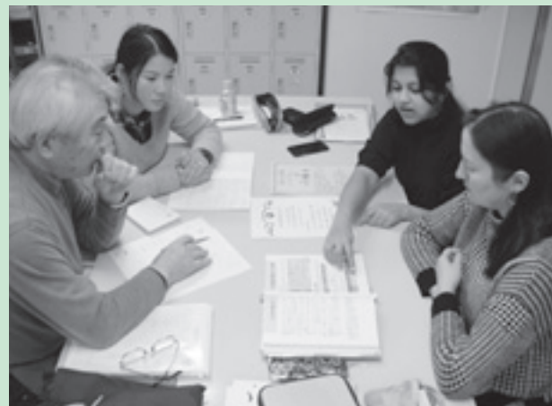
日本語支援の様子