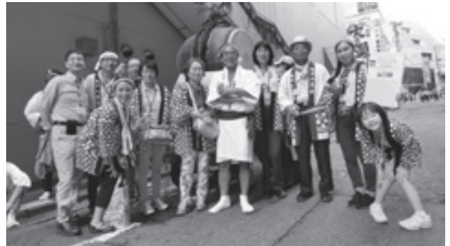
盛り上げてくれた交流部会の方々