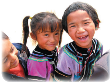
中国・雲南のこども達

中国・雲南省は東南アジアと接する山岳地帯で、漢民族の他に25の少数民族が独自の文化を守りながら暮らしています。都市部に比べて経済や教育の面で取り残されがちな少数民族の子どもたち。