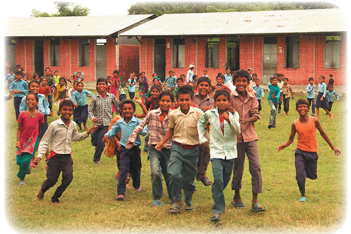
ネパール・ルンビニのこども達

(注) ネパール南部のインドとの国境近くにある村。釈迦の生誕地としても知られる仏教の聖地で、人々は優しいが生活は貧しい。