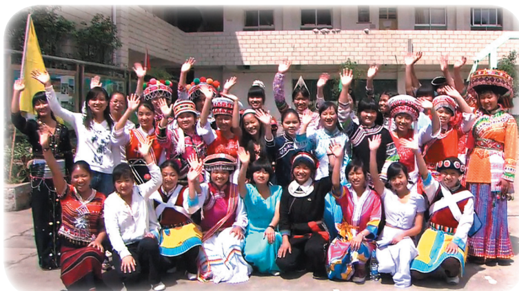
「25の小さな夢基金」が応援する昆明女子中学・春蕾高校生クラス